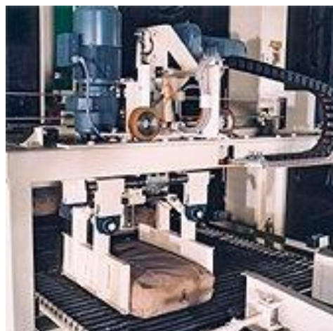
Estrela rotativa PIKOMAT-NDL pórtico