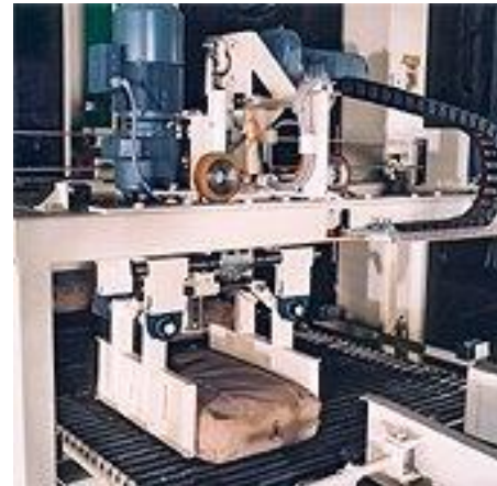
Drehstern PIKOMAT-NDL Portal